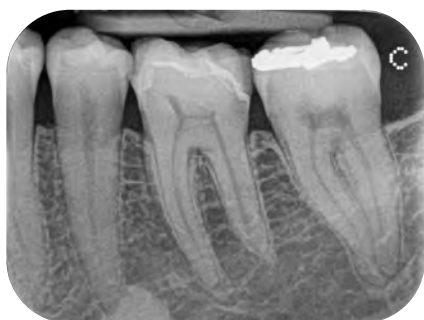
Zobrazení snímků za pouhých pět sekund.