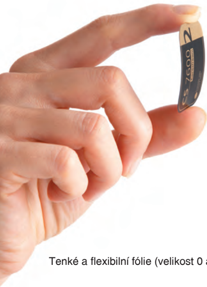
Tenké a flexibilní fólie (velikost 0 až 4).